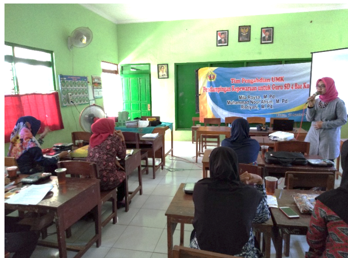
Gambar 3. Pelaksanaan Pendampingan Kepewaraan di SD 4 Bae Kudus

Selain kemampuan verbal, peningkatan juga terlihat pada aspek nonverbal. Guru mulai mampu memanfaatkan kontak mata, ekspresi wajah, dan bahasa tubuh secara lebih proporsional sehingga komunikasi yang dilakukan menjadi lebih menarik dan komunikatif. Hal ini menunjukkan bahwa proses pendampingan berbasis praktik memberikan pengalaman belajar yang efektif dalam meningkatkan keterampilan keprofesionalan peserta.