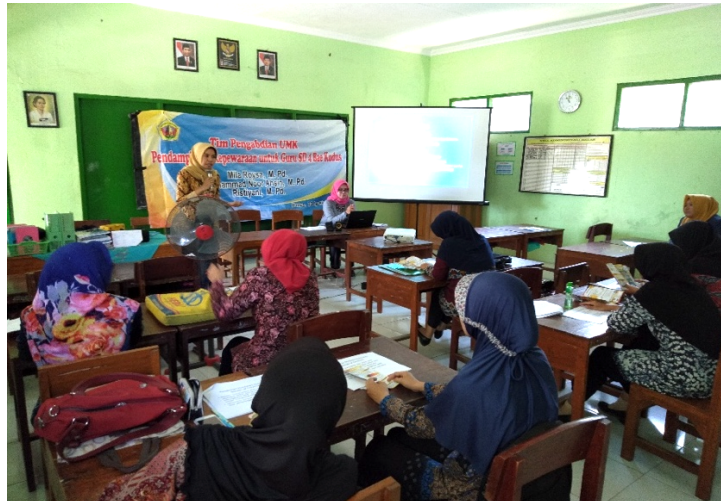
Gambar 2. Penjelasan Materi Kepewaraan untuk Guru SD 4 Bae Kudus

acara profesional dalam berbagai konteks kegiatan. Tahap ini bertujuan memberikan gambaran nyata mengenai teknik membuka acara, menghubungkan antaragenda, memperkenalkan narasumber, serta menutup acara secara efektif. Pada tahap praktik, peserta diberikan kesempatan untuk menyusun naskah acara dan mempraktikkannya secara langsung. Pendamping memberikan umpan balik terkait aspek kebahasaan, artikulasi, ekspresi, kontak mata, bahasa tubuh, dan penguasaan panggung. Proses ini memungkinkan peserta memperoleh pengalaman belajar yang lebih kontekstual dan aplikatif.