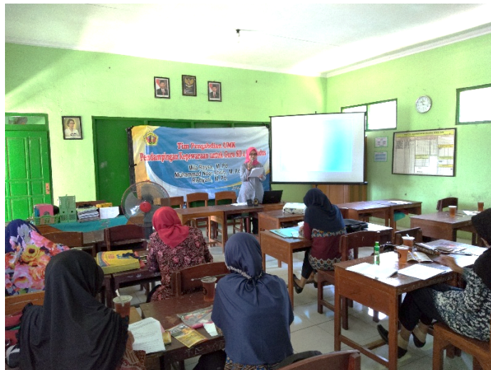
Gambar 4. Evaluasi dan Refleksi Pendampingan Kepewaraan di SD 4 Bae Kudus